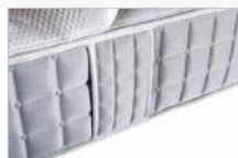
Extra breite Wendegriffe