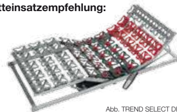
Abb. TREND SELECT DE LUXE