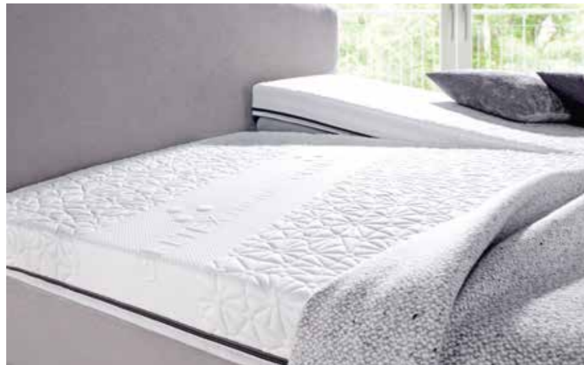
TOPPER GELTEX® 8 cm hoher Topper mit GELTEX® Kerntechnologie und abnehmbarem Smarttec-Bezug. Waschbar bis 60° C. Ab 160 cm Breite in Split-Ausführung im Kopfbereich erhältlich.

Bei Boxspringbetten ist der Topper das berühmte Tüpfelchen auf dem i. Er ist nicht zwingend notwendig, hat aber einen hohen Genuss-Wert und macht Ihr Boxspringbett erst richtig kuschelig. Bestes Beispiel ist das Topper-Duo der sembella® Boxspring-Kollektion. Je nach Vorlieben profitieren Sie von druckentlastendem, atmungsaktivem GELTEX® oder unserem punktelastischen, klimaregulierenden BÜLTEX®-Kaltschaum.