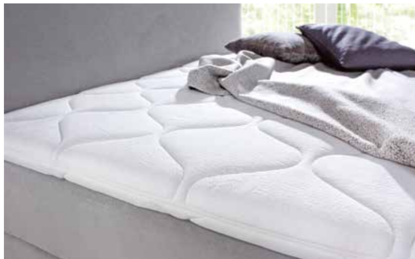
TOPPER BÜLTEX® 7 cm hoher Topper aus BÜLTEX®-Kaltschaum mit abnehmbarem Bezug. Waschbar bis 60° C.