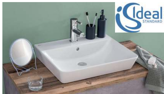
Ideal Standard CONNECT AIR Keramik-Aufsatzwaschtisch, weiß

Umfangreiche Auswahl an Ergänzungsschränken erhältlich - siehe Typenliste! Abbildungen und Angaben sind unverbindlich. Technische Änderungen vorbehalten. puris Bad GmbH & Co. KG - Hinterm Gallberg 6a - 59929 Brilon - www.puris.de - mail@puris.de