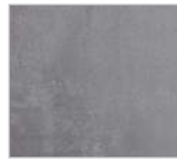
Nr. 679 / 179 Betonoptik