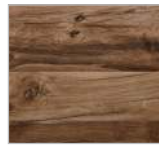
Nr. 174 Hunton Eiche