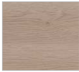
Nr. 794 / 194 Eiche Sand