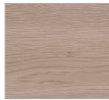
Nr. 194 Eiche San