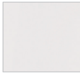
Nr. 722 / 101 (161) Polarweiß hgl. / Weiß (hgl.)