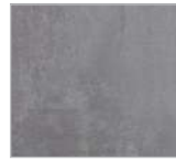
Nr. 179 Betonoptik